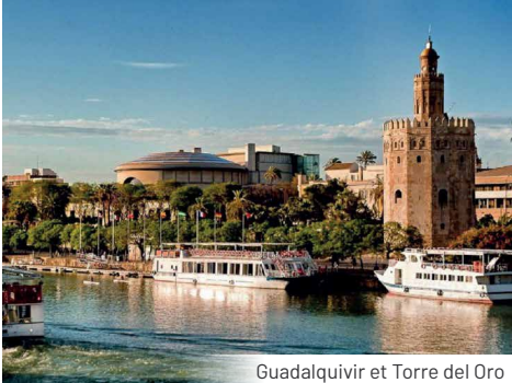
Guadalquivir et Torre del Oro