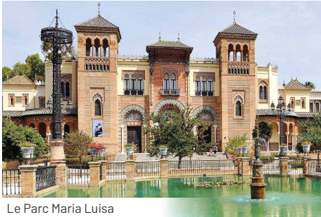
Le Parc Maria Luisa