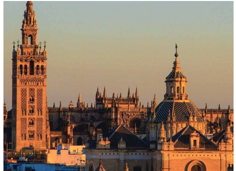
La Cathédrale et la Giralda de Séville