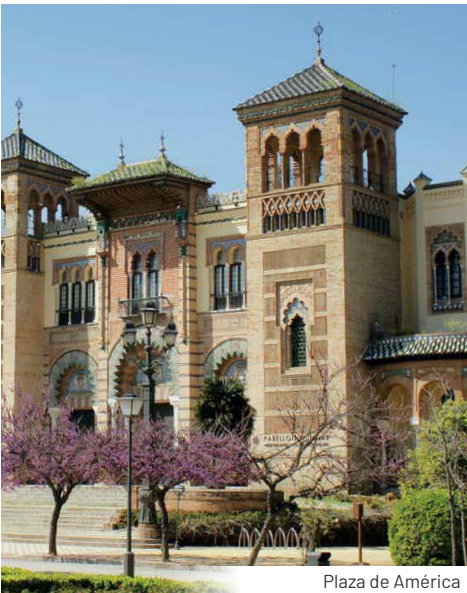
Plaza de América